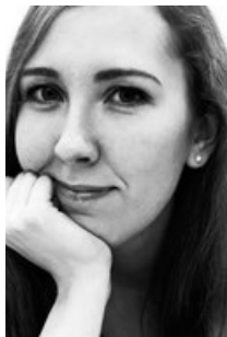
Greta Ernesaks (Estonsko / Estonia)